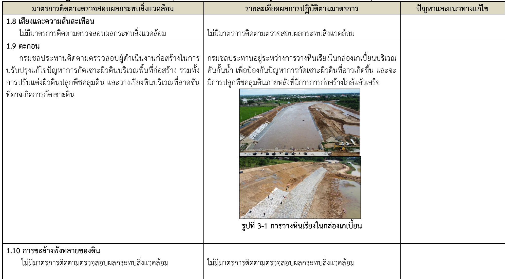
รูปที่ 3-1 การวางหินเรียงในคลองเกเบียน